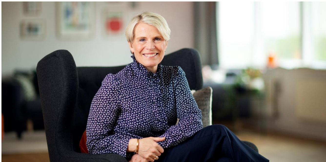
VD HAR ORDET